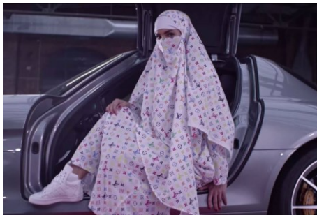
Le même Argent-Roi en islam et en Occident