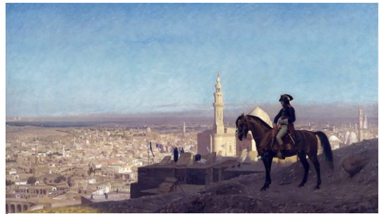
Bonaparte au Caire, ou l'irruption des Lumières en terre d'islam

En ces temps de grande confusion, alors que le sujet essentiel des rapports entre islam et société française est soigneusement évité dans le tour pris par le débat public, ou n'est abordé qu'en surface, voici une analyse originale du sujet : comparer les fondements et les déploiements des espérances et projets politiques nés de l'islam d'une part et nés des Lumières d'autre part, elles qui, depuis deux siècles, façonnent la France, l'Occident et jusq'au monde entier.