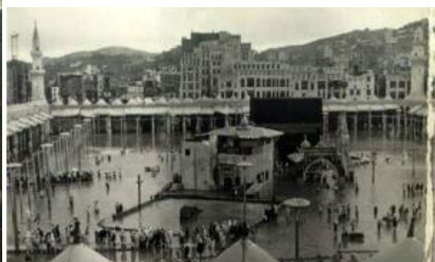
[regelmatige overstromingen te Mekka]